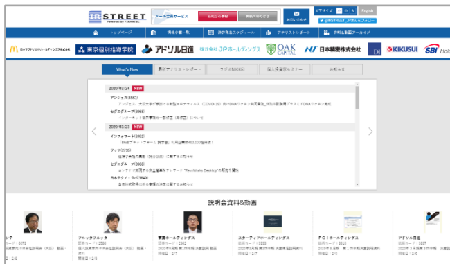
日本語サイト トップページ